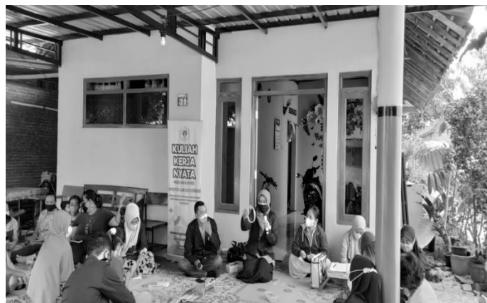
Gambar 3. Penyampaian materi

Kegiatan pelatihan ini melibatkan masyarakat Desa Purbayan yang tergabung dalam ibu-ibu PKK RT 01 RW 07 Pandeyan sebanyak 22 orang. Peserta pelatihan semua berjenis kelamin wanita dengan rentang usia 25-65 tahun. Selama kegiatan pelatihan berlangsung, peserta menunjukkan antusiasme yang tinggi. Peserta terlihat fokus dan menaruh perhatian penuh ketika tim melakukan presentasi materi. Peserta juga aktif dalam pelatihan, terlihat dari partisipasi peserta secara langsung dalam proses demonstrasi alat, bahan, dan cara meronce manik-manik menjadi konektor masker, seperti yang ditampilkan pada Gambar 3 dan 4.