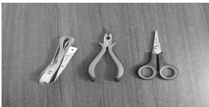
Gambar 1. Alat yang digunakan

Kegiatan pemberdayaan masyarakat melalui pelatihan pembuatan hasta karya konektor masker dari manik-manik ini telah dilaksanakan dan mendapat respon yang baik dari para peserta pelatihan. Pelatihan ini diharapkan dapat memberikan manfaat yang nyata bagi masyarakat di Desa Purbayan, terutama dalam memberikan solusi dalam mengatasi perekonomian yang sedang menurun akibat pandemi Covid-19. Dengan keterampilan ini, diharapkan dapat memberikan alternatif pekerjaan dan pendapatan bagi para peserta pelatihan. Alat dan bahan yang digunakan dalam pembuatan konektor masker dari manik-manik ditampilkan pada Gambar 1 sebagai berikut.