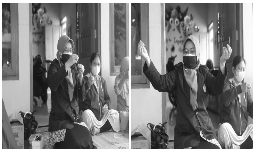
Gambar 4. Proses demonstrasi pembuatan hasta karya konektor masker