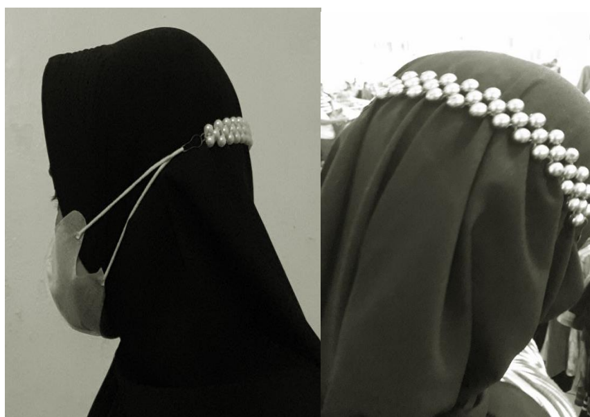
Gambar 7. Pemakaian produk konektor masker dari manik-manik