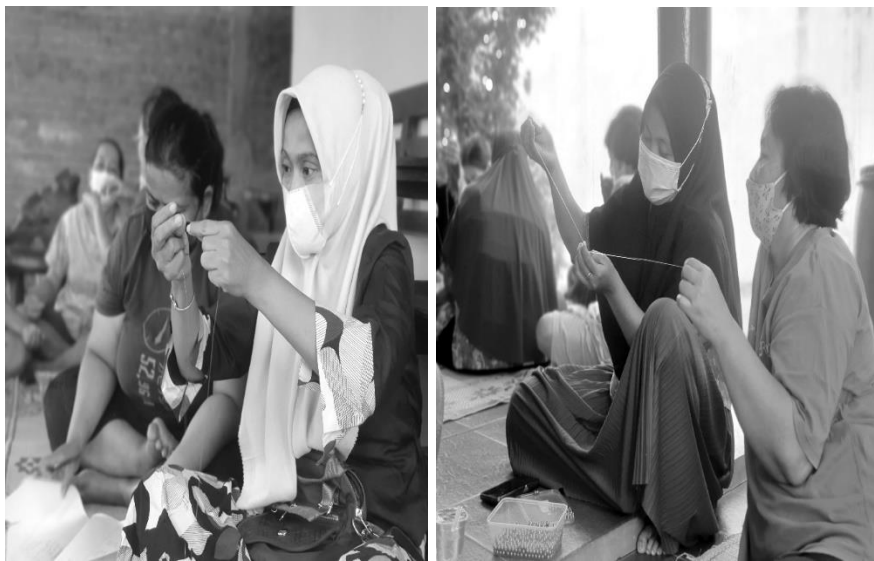
Gambar 5. Peserta praktik membuat hasta karya konektor masker